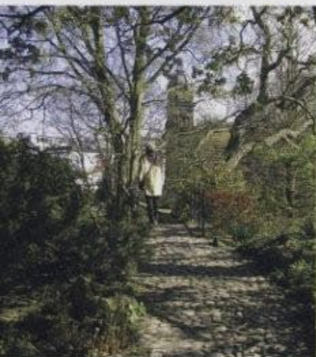
Verdauungsspaziergang in Planten un Blomen

Ständige Vertretung (22) , gut für eine Shoppingpause oder zur Erholung nach einer Erkundung der Neustadt. Wer es rustikal mag, kann hier günstig den Mittagstisch genießen. Für Geduldige gibt's auch